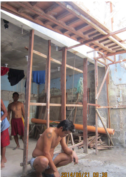
A l'arrière, une salle de réunion avec à l'étage une chambre d'accueil et une petite cuisine

Fin mai 2014, nous avons lancé de gros travaux de rénovation de la maison des étudiants boursiers. Dans une première phase, il s'agissait de changer tous les châssis, entièrement rouillés, d'aménager des armoires de rangement des affaires personnelles des jeunes, d'ajouter une salle de bain, de percer des nouvelles fenêtres pour faciliter la ventilation et de relever le rez-de-chaussée qui risque d'être inondé lors des typhons. Une petite salle d'étude sera inaugurée car jusqu'à aujourd'hui, les jeunes étudiaient par terre ou assis sur un banc.